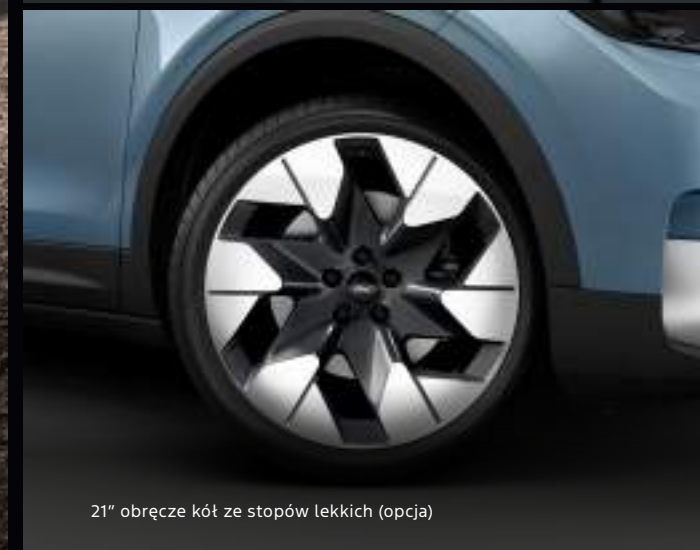
21" obręcze kół ze stopów lekkich (opcja)