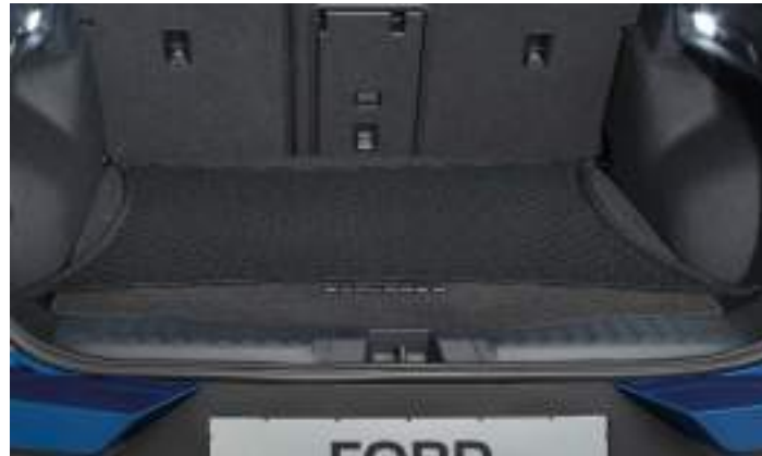
SIATKA PRZYTRZYMUJĄCA BAGAŻ (2 772 747) 304 zł