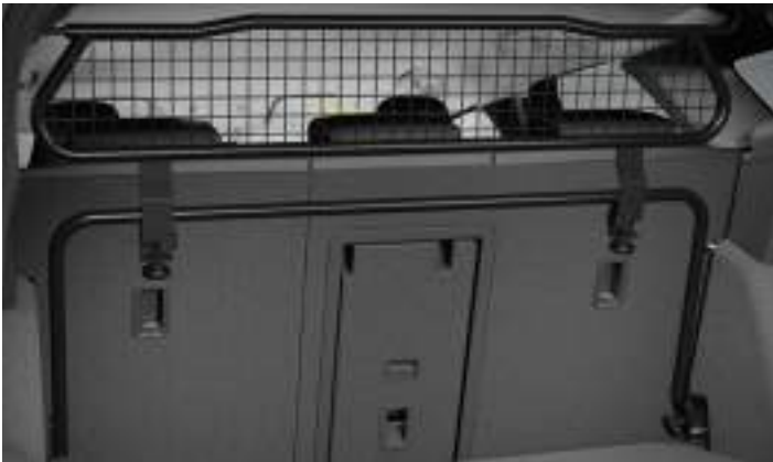
KRATKA OCHRONNA (2 718 464) 2 066 zł