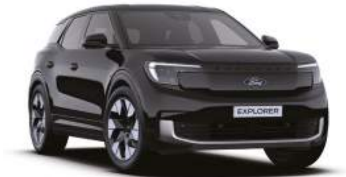
AGATE BLACK - LAKIER METALIZOWANY 3 000 zł