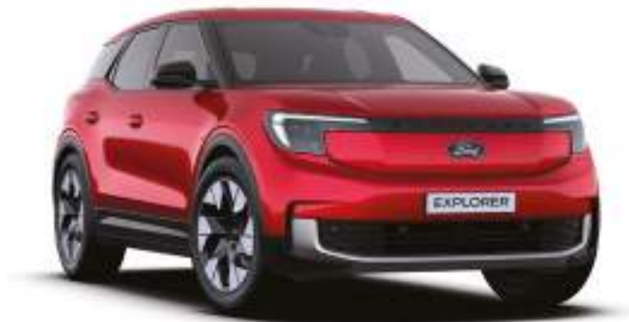
LUCID RED - LAKIER METALIZOWANY SPECJALNY 4 500 zł