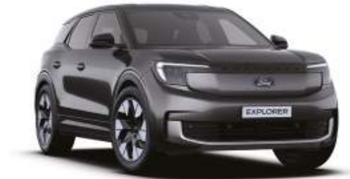
MAGNETIC GREY - LAKIER SPECJALNY 3 000 zł