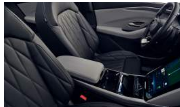
TAPICERKA SKÓRZANA (SKÓRA EKOLOGICZNA SENSICO)