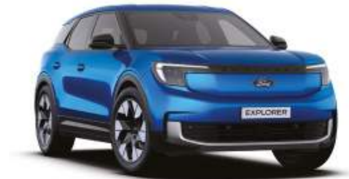
BLUE MY MIND - LAKIER METALIZOWANY SPECJALNY 4 500 zł