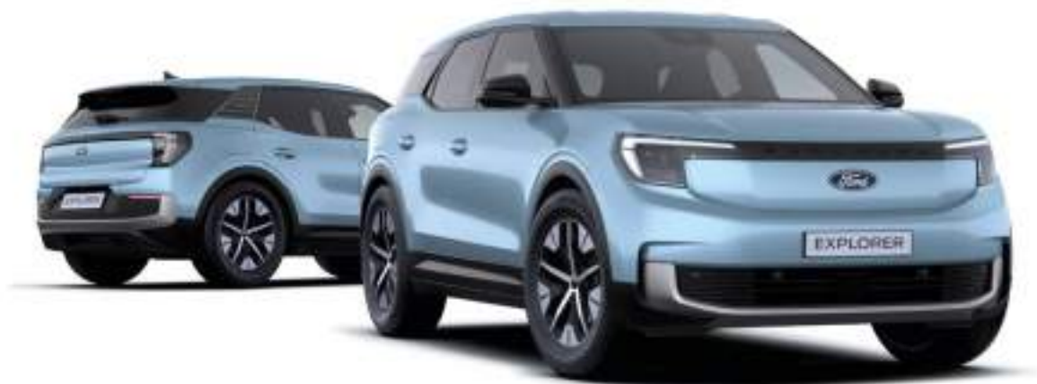
Nowy Ford Explorer w wersji Explorer z 19" obręczami ze stopów lekkich (standard dla wersji z bateriami o zwiększonej pojemności) oraz lakierem metalizowanym Artic Blue (bez dopłaty)