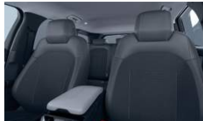
PRZEDNIE FOTELE ERGONOMICZNE, Z CERTYFIKATEM AGR, Z TAPICERKĄ CZĘŚCIOWO SKÓRZANĄ (SENSICO / ETON BLACK ONYX)