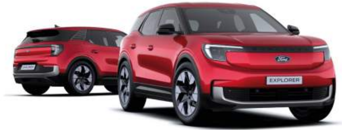
Nowy Ford Explorer w wersji Premium z lakierem metalizowanym specjalnym Lucid Red (opcja)