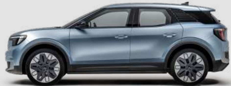
Długość całkowita: 4468 mm