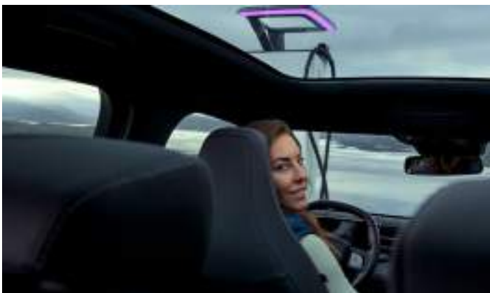
DACH PANORAMICZNY Opcja dla wersji PREMIUM