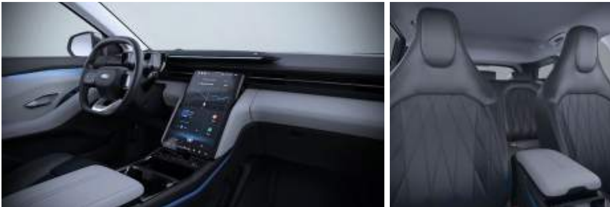
Nowy Ford Explorer w wersji Premium z tapicerką skórzaną - skóra ekologiczna Sensico (standard)