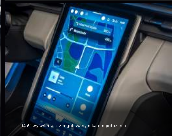
14.6" wyświetlacz z regulowanym kątem położenia