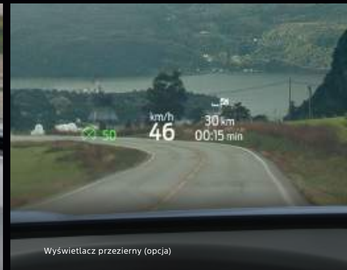
Wyświetlacz przezierny (opcja)

Nowy Ford Explorer w wersji Premium z opcjonalnym wyposażeniem