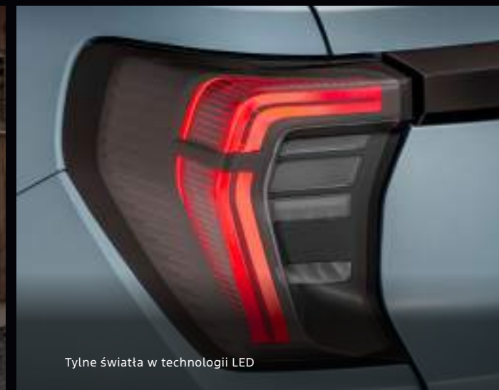
Tylne światła w technologii LED

Nowy Ford Explorer w wersji Premium z opcjonalnym wyposażeniem Kolor Nadwozia: Artic Blue (opcja)