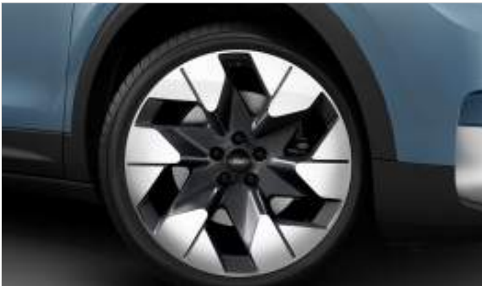
20" KOŁA ZIMOWE (4 SZTUKI) Z OPONAMI GOODYEAR ULTRAGRIP PERFORMANCE + 255/45R20 105 T XL (2 773 477) 10 036 zł