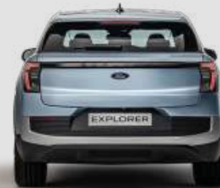
Szerokość całkowita z lusterkami: 2063 mm