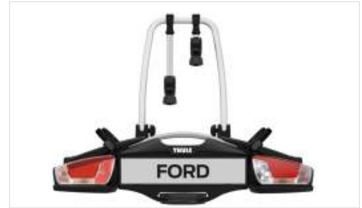
THULE®* MOCOWANY Z TYŁU POJAZDU BAGAŻNIK ROWEROWY (2 353 442) 3 063 zł