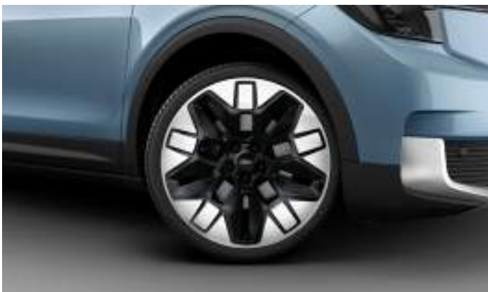
21" OBRĘCZE KÓŁ ZE STOPÓW LEKKICH Opcja dla wszystkich wersji