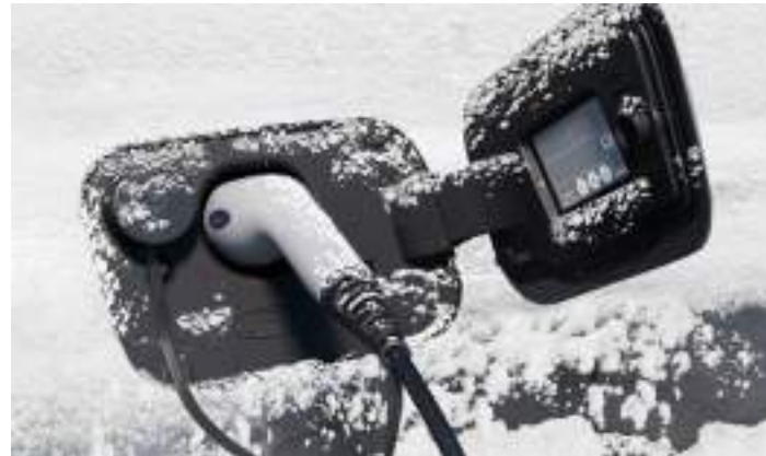
OSŁONA PORTU ŁADOWANIA (2 730 817) 115 zł