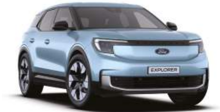
ARCTIC BLUE - LAKIER METALIZOWANY bez dopłaty