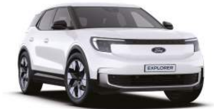
FROZEN WHITE - LAKIER ZWYKŁY 1 500 zł